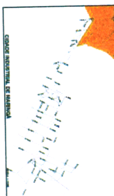
CIÓDICE INDUSTRIAL DE MARINGÁ