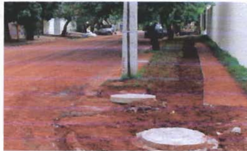
Figura 05 e 06: Vista das obras de implantação da rede de esgotamento sanitário no Bairro Santa Rosa – Zona 44. Março/2014.

Lá constatamos que os serviços estão em andamento regular e sendo executados dentro das Normas técnicas vigentes, sinalizados, com qualidade e segurança.