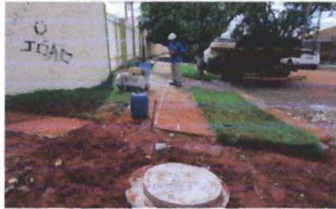
Figuras 01 e 02: Vista das obras de implantação da rede de esgotamento sanitário no Bairro Santa Rosa – Zona 44. Março/2014.