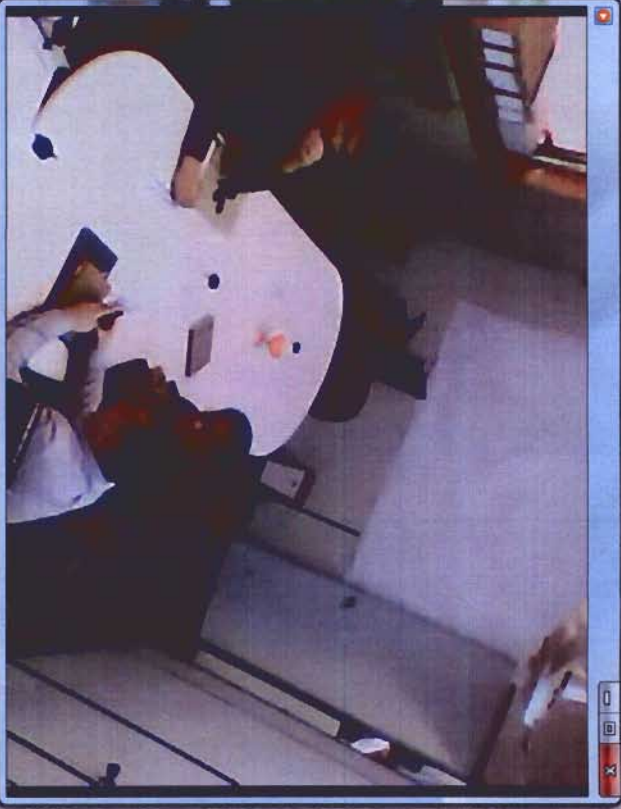
Licitação Online Sala 1