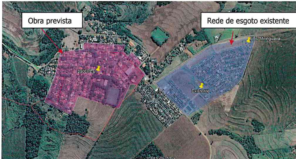
Figura 1 – Área prevista e existente.