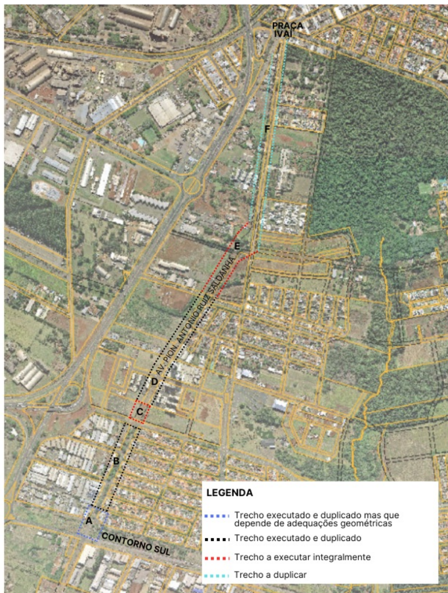
FF Figura 01: Trecho da Avenida Pioneiro Antônio Ruiz Saldanha.

De acordo com a figura 01, o trecho "A" encontra-se pavimentado, contudo, necessita de adequações geométricas conforme já apresentado à Câmara por meio do processo 01.02.00105204/2024.09, despacho 4480662. As adequações geométricas neste trecho são necessárias tendo em vista que no local há torres de transmissão de energia elétrica da Eletrosul e da Copel (ambas de 230kv) onde figura uma faixa de domínio das concessionárias com esta destinação. Quanto à viabilidade da implantação da pavimentação, verificamos que o posteamento da Eletrosul necessita estar a uma distância mínima de 15 (quinze) metros do meio fio do prolongamento da via em questão, segundo a Orientação Técnica SEMAL 04/2020, fornecida pela Eletrosul em contato com o IPPLAM.