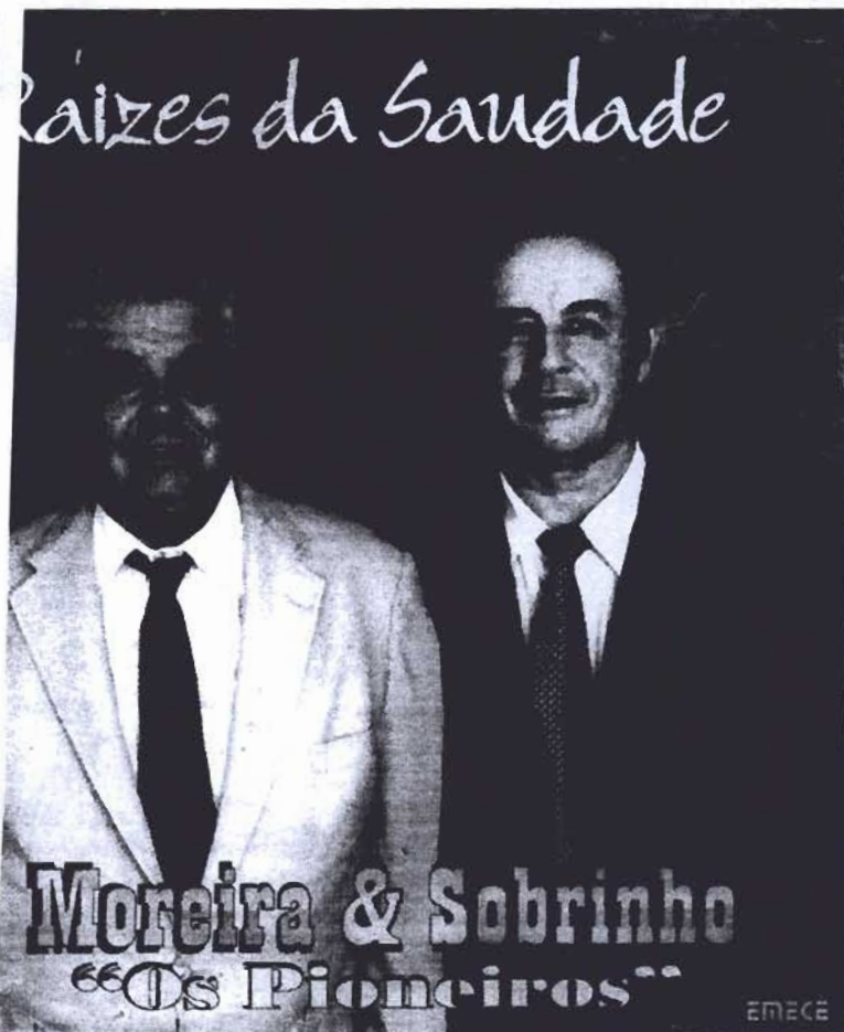
Dupla lançou CD, em 2003, com 12 músicas raízes compostas por Moreira