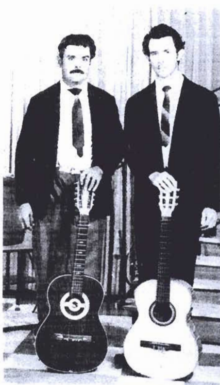
» Tio e sobrinho viram Maringá nascer

Lama e poeira eram o que mais atrapalhava a locomoção. "Mas o esforço