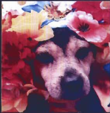
O cãozinho idoso Billy

Costaríamos de registrar nosso muito obrigado por nos ajudar a manter a ONG firme e a acreditar que juntos somos mais fortes! O abrigo é aberto para visitas e trabalhos voluntários. Entre em contato conosco!